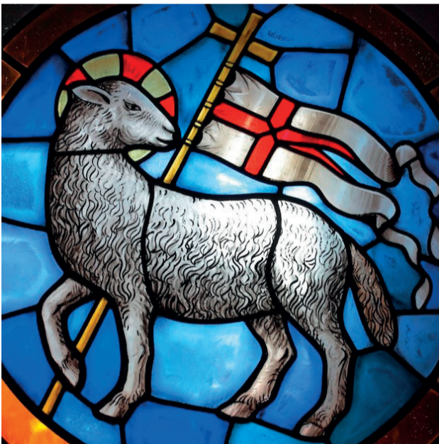
LAMM GOTTES Glasmalerei in der Kathedrale in Florenz (18. Jahrhundert).