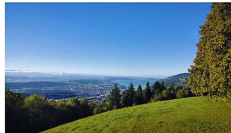
Seeland - Bözingenberg - Messen

Abfahrt: 9.15 Uhr Bahnhof Weier 9.15 Uhr Bahnhof Häusermoos 9.30 Uhr Gemeindezentrum